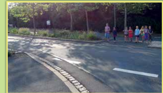
3 Übergang Heuchelhofstraße Richtung Prager Ring - Haltestelle Athener Ring ohne Ampel und ohne Zebrastrreifen über Verkehrsinseln