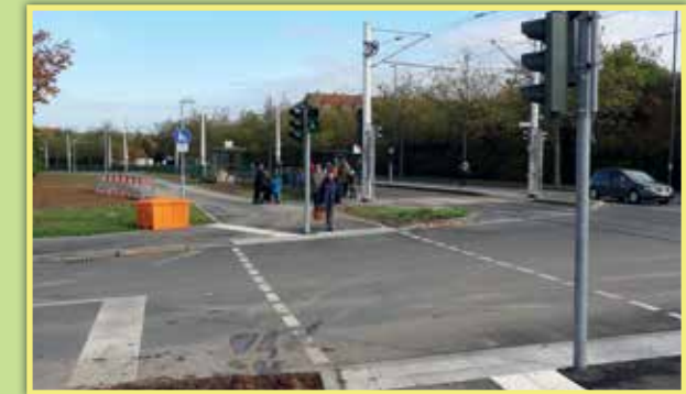
1 Neue Ampelanlage Moskauer Ring