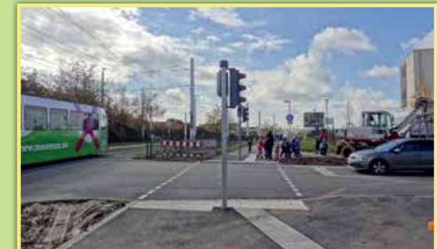
2 Nutzung des neuen Weges vom Wiener Ring zum Mwanza-Weg entlang der Straßenbahngleise